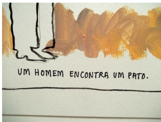
Figura 1 - trecho da história "O Pato", publicada no blog pessoal de Odyr (BERNARDI, 2012c)

Ainda mais radical é o exemplo abaixo, onde um acidente provocado pela tinta acaba por justificar a obra como um todo, se tornando o eixo do texto que acompanha a ilustração: