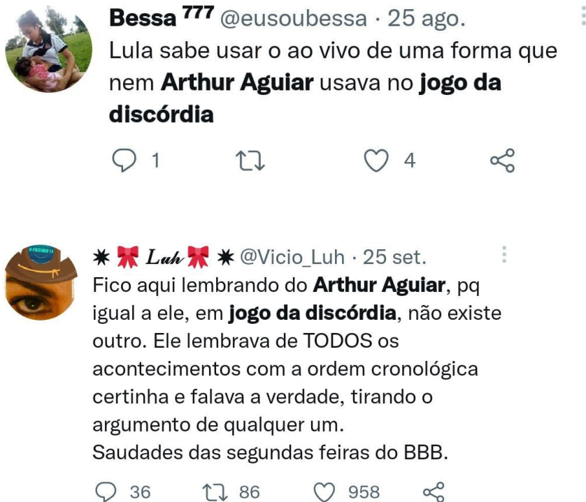
Figura 1 - Comentários de internautas

Acredito que o fato dele não perder o controle nos jogos da discórdia que antecede a noite de eliminação foi um divisor de águas para que ele chegasse até a final, muitos telespectadores gostavam das atitudes dele e iam para as redes sociais parabenizá-lo pela sua memória, autocontrole e educação. Um internauta chegou até a comparar o presidente eleito Luiz Inácio Lula da Silva com Arthur Aguiar por saber usar o ao vivo “como ninguém” (Figura 1).