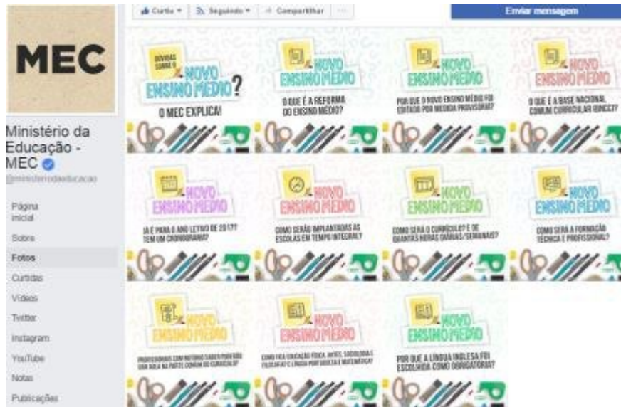
Imagem 4. Álbum do MEC com publicações sobre o Novo Ensino Médio.

O álbum do Ministério da Educação apresenta uma série de publicações que esclarecem dúvidas como sobre o Novo Ensino Médio, as perguntas, por exemplo, são: “Como será a Formação Técnica e Profissional? ”, “O que é a Base Nacional Comum Curricular (BNCC)? ”, “Por que a língua inglesa foi escolhida como obrigatórias? ”, entre outras perguntas. Essa é uma estratégia comunicacional do MEC para manter o diálogo com era da pós-verdade, assim, reconhecendo a força social que a sociedade midiática possui diante ao governo.