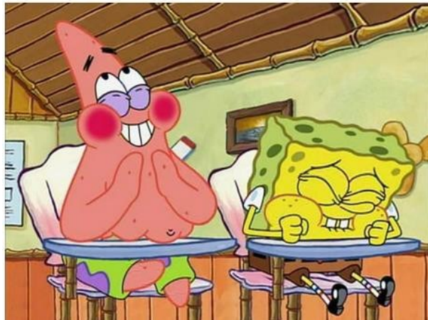
Imagem 3. Quiz realizado pelo BuzzFeed sobre o Novo Ensino Médio.

Em fevereiro de 2017, o site colaborativo BuzzFeed , realizou um quiz nomeado de “Este quiz vai te fazer entender a Reforma do Ensino Médio” e o mesmo revela que, as pessoas respondem as perguntas incorretamente, o que nos faz compreender que algumas pessoas não compreendem as propostas que a Reforma possui e sim, são levadas a acreditar em discursos providos de valores políticos.