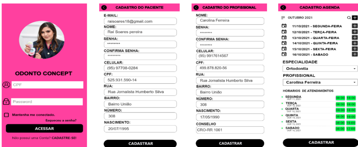
Figura 3 Telas iniciais da aplicação

Para realizar o acesso ao aplicativo Odonto Concept o paciente deverá preencher os campos de CPF e Password corretamente, caso seja a primeira utilização é necessário que o novo usuário efetue seu cadastro, preenchendo seus dados de identificação e senha de usuário, para os acessos de profissionais os cadastros serão realizados pelo administrador da clínica.