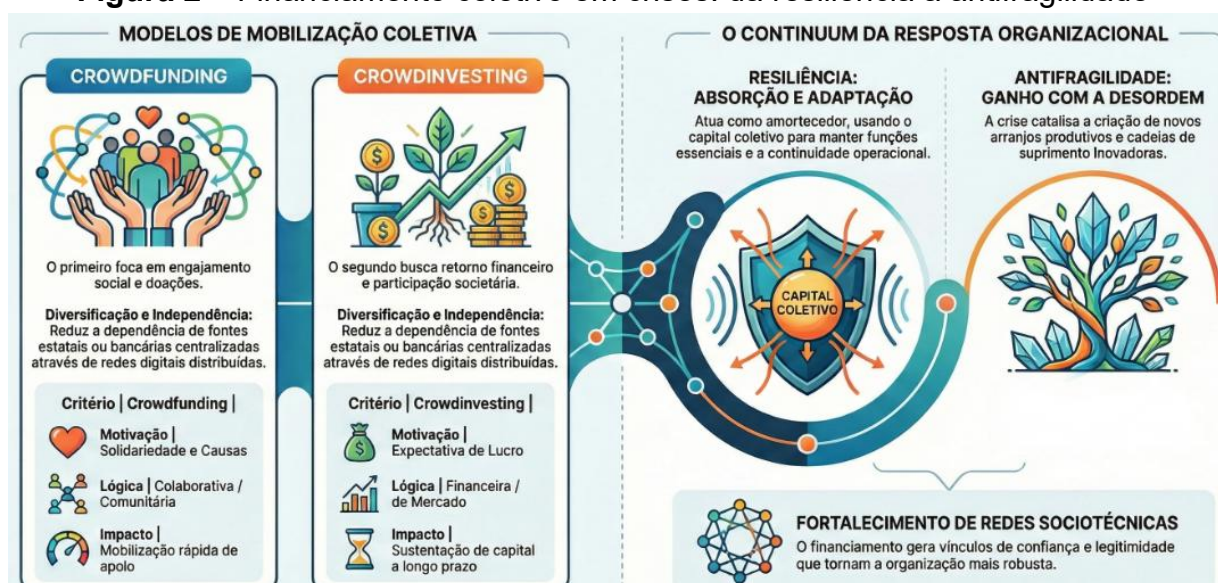
Figura 2 – Financiamento coletivo em crises: da resiliência à antifragilidade

O financiamento coletivo fortalece a participação social e a coprodução de soluções em contextos de crise, ampliando o papel da sociedade civil na sustentação de iniciativas coletivas. A mobilização digital de recursos e apoio simbólico contribui para formação de redes de solidariedade e identidade compartilhada. Nessa linha de raciocínio, o fenômeno possui dimensões econômicas e sociopolíticas interligadas (Figura 2).