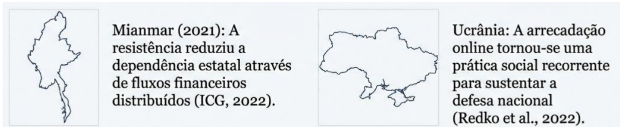
Figura 1 – Casos de Mianmar e Ucrânia como fontes